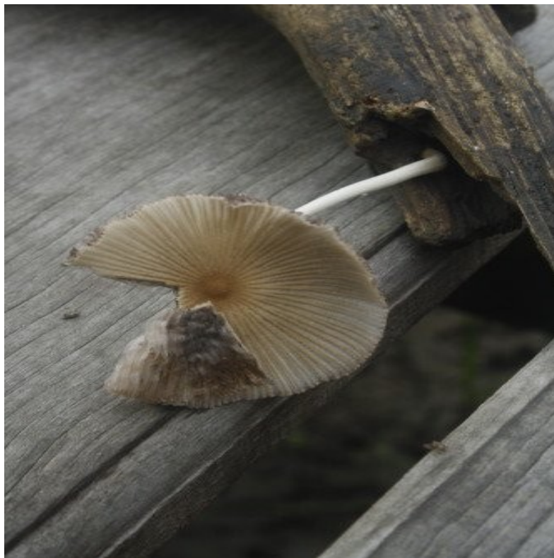
foto jamur di jalan papan kayu, hutan mangrove wonorejo

surabaya, 6 mei 2011, anithasilvia@gmail.com makantinta.blogspot.com